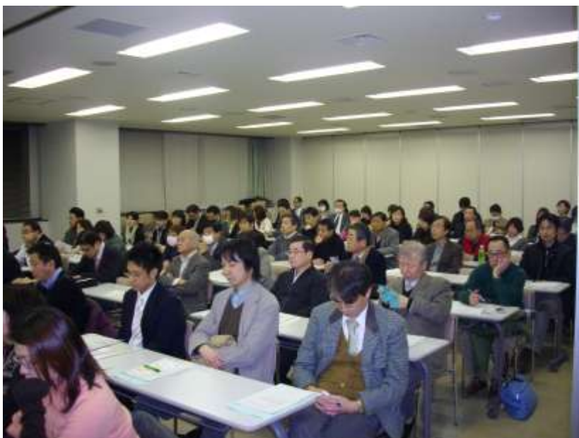
2010年度医療従事者研修会