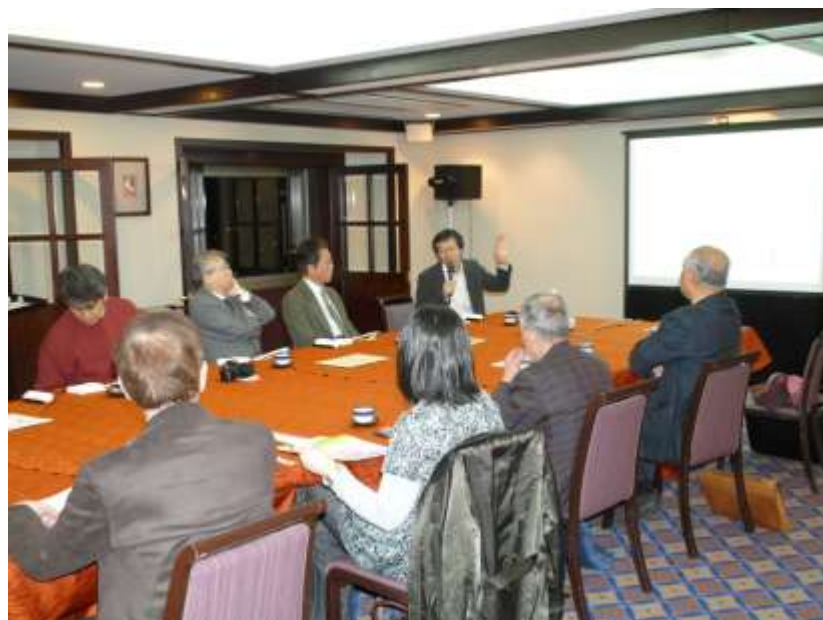
小グループによる研修会